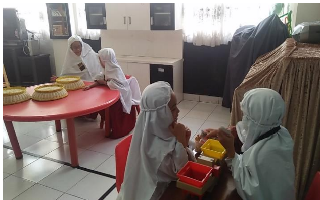
Gambar 4. Anak dapat menyesuaikan diri dan berinteraksi dengan anak lain