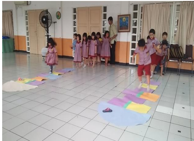
Gambar 6. Anak menunggu gilirannya dalam bermain

Minartin (2013) mengemukakan bahwa perilaku sosial anak merupakan kemampuan anak dalam menjalin hubungan yang baik dengan sesama teman, guru, maupun orangtua. Jadi dapat dikatakan perilaku sosial baik dalam aktivitas sehari-hari maupun dalam berbagai kegiatan berhubungan dengan semua orang. Perilaku sosial menjadi salah satu aspek yang penting untuk dikembangkan sebagai bekal kehidupan anak untuk masa yang akan datang. Didalam menjalin hubungan dengan orang lain anak mengalami peristiwa yang bermakna dalam kehidupannya dan membantu anak membentuk kepribadian.