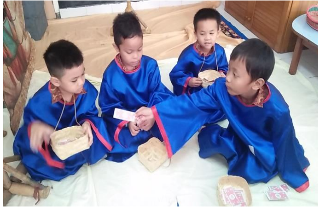
Gambar 3. Anak membagi upah sama banyak kepada karyawan