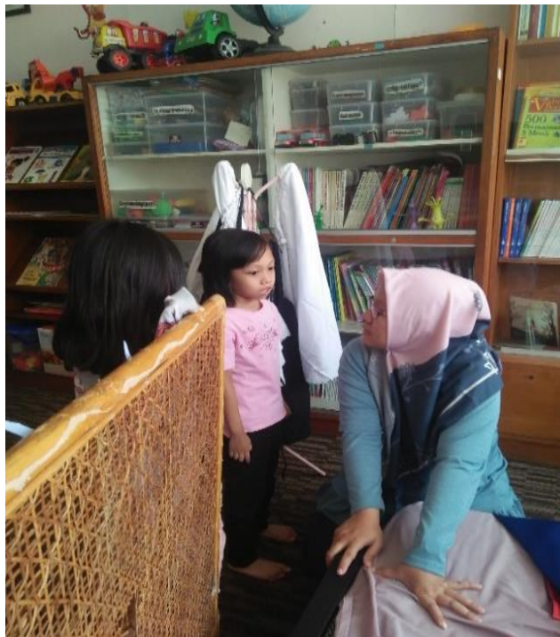
Gambar 1. Anak menyemangati teman yang sulit dalam memilih peran

Hasil penelitian didapatkan bahwa perilaku sosial anak 5-6 tahun di Taman Kanak-kanak Labschool Jakarta menunjukkan perilaku sosial yang berkaitan dengan hubungan kemanusiaan yaitu hubungan baik sesama manusia ( social humanity ) yaitu empati, toleransi, kerja sama, tanggung jawab, adil, perilaku akrab, berbagi dan menunggu giliran.