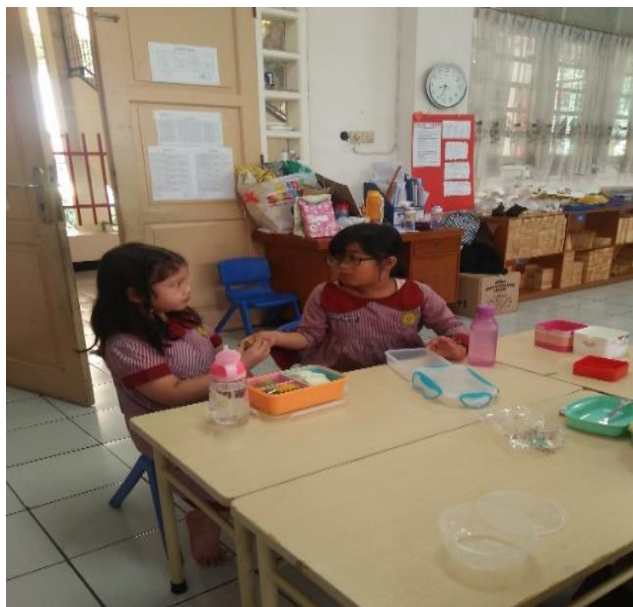
Gambar 5. Anak berbagi makanan dengan temannya