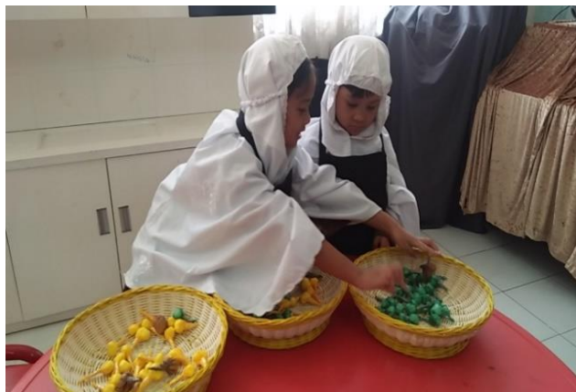
Gambar 2. Anak saling tolong menolong dalam memisahkan kurma